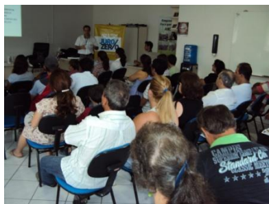
Café da Manhã Programa Juro Zero